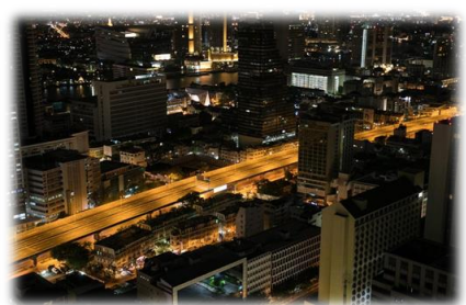
疫情下的曼谷：宵禁、停市、停課