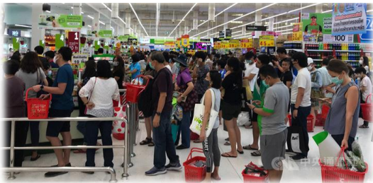
超市出現搶購熱，大排長龍

搶肉、搶蛋、搶麵、搶菜的情況，內心湧著一股無奈想哭的聲音：「究竟世界發生甚麼事？我們要淪落到這樣....」內心還未得平伏，由於停課停市，很多泰人都