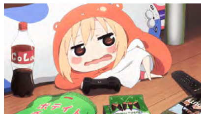
成為呼吸.....在說宅在家的習慣嗎？

泰語我認為最難掌握是音要準確無誤。很奇怪的一件事，如果你有一位外國朋友 😞 說廣東語的口音不準，你依然會明白他說什麼，但我發現在這裡很多時候如果你發音不準 🙄🙄🙄 人家便不明白你說什麼。例如有一次我去飯店買外賣，當那店員拿起一個膠袋時，我指著那膠袋說 🙄:「 ไม่เอาถุง 」(不要袋)，然後那位伙記呆看著我 😞 我便再伸長手指著那膠袋說多一次:「 ไม่เอาถุง 」那伙記還是呆看著我 😞 那刻我不知道要說什麼令他明白時，旁邊一位泰國人 🙄 幫我跟那伙記說:「 ขอบอกว่าไม่เอาถุง 」我立即明白過來，我是那個 ถุง 字錯了，把 ง ，讀了 น ，內心不禁說 😞 「大佬呀，差少少啫，都指住個膠袋啦，唔係咁都唔明呀嘛！」就是！就是差這個少少，人家就是不明白你說什麼！後來跟朋友分享，她丈夫是泰國人 🙄 他便教我以後邊加一個 หัว 字，變成 ไม่เอาถุงหัว (不要手抽袋)，又或是加 plastic ，變成 ไม่เอาถุง plastic (不要膠袋)，那便容易令人明白。好難呀 🙄🙄🙄 這只是其中一個例子，每天發生呢類的傻事多不勝數，不是人家不明白我而呆了 🙄 或是不明白人家而呆了 🙄 的情景經常發生。