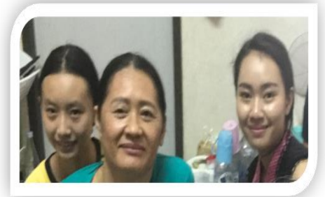
早前攝影 左：阿邁、中間：媽媽

探訪當天，我們唱詩、分享經文及詢問媽媽的信仰情況，她表達自己已確信耶穌，真的感謝神！之後我們為她能起來行走及得醫治禱告，要用泰文表達這樣