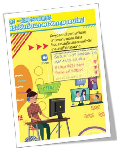
大學生交流活動宣傳

機會打電話關心幾個確診的家長，為他們禱告；疫情下所有學生都有電話，神刺激了我們以「溫習中文」的名義去邀請他們每星期與家恩談話 10 分鐘，保持關係、表達關心，現在已有 9 位學生報名，其中有四位是新生呢！